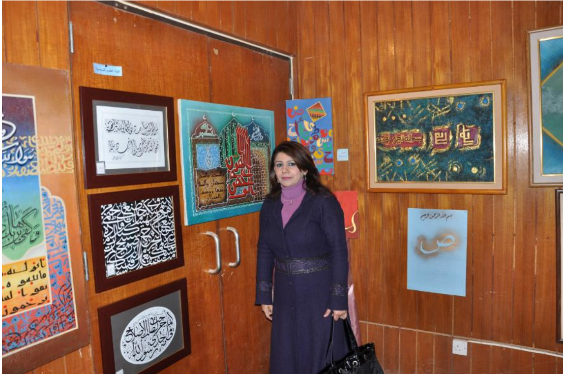
جانب من اعمال النشاط الفني في الكلية

وتقام المعارض الفنية في الكلية منها معرض الفنون التشكيلية ومعرض الصور للتراث العراقي والتصوير الفوتوغرافي ومعرض الخط العربي ومعرض الكاريكاتير . كما تتشارك الكلية في المهرجانات والمسابقات الثقافية التي تقام في الجامعة كمهرجان الموسيقى ومهرجان المسرح ومهرجان الشعر .