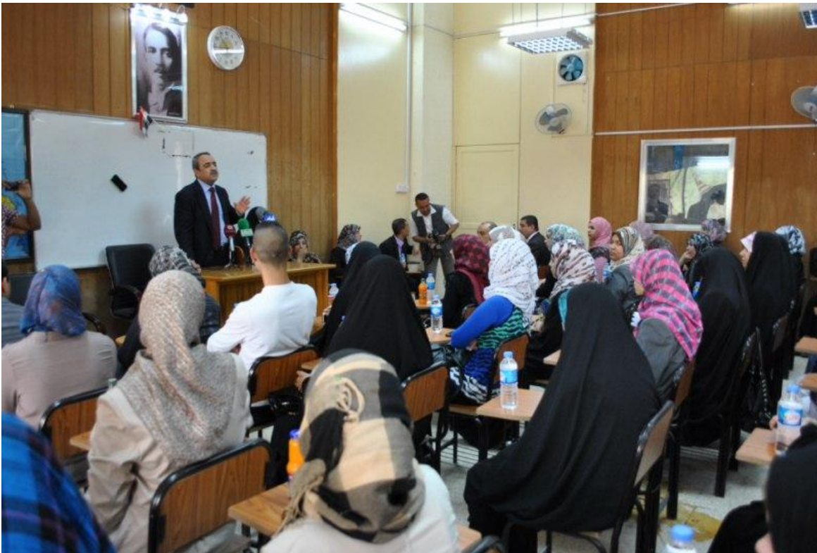
عميد الكلية لدى استقباله خيوفه الكلية لسنة ٢٠١٢