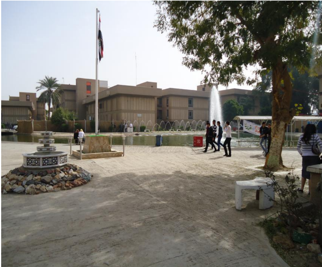
أحدى ساحات الكلية