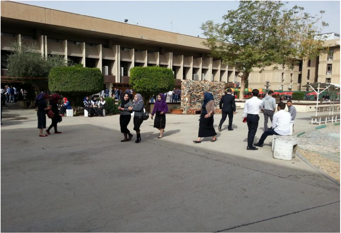
الطلبة في وقت الاستراحة

إن مدة الدراسة في هذه المرحلة أربع سنوات تنتهي بمنح الطالب درجة البكالوريوس في العلوم السياسية. وتتشرك الفروع العلمية الثلاثة في منح هذه الدرجة في الاختصاص العام للعلوم السياسية. والنظام المعمول به هو النظام السنوي، ولغة التدريس هي اللغة العربية باستثناء موضوع تخصصي واحد يدرس باللغة الانكليزية في كل سنة من سنوات مرحلة البكالوريوس. ويتضمن المنهاج الدراسي للبكالوريوس الموضوعات السنوية الآتية: