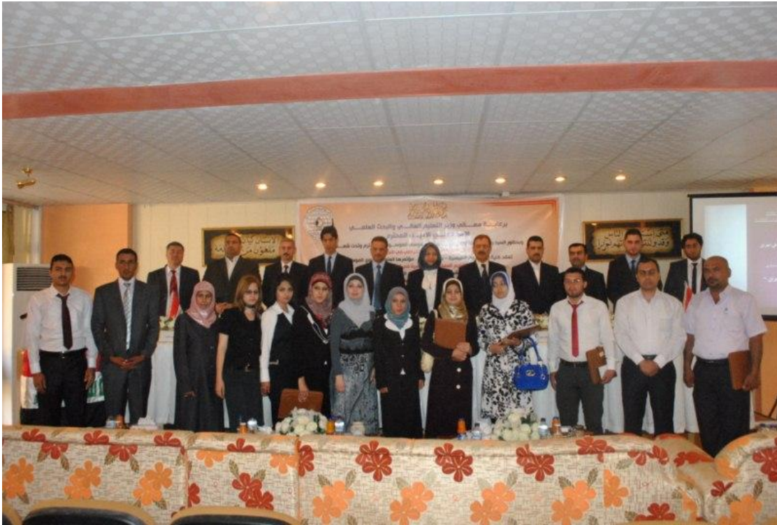
المؤتمر الطلابي السنوي للكلية لعام ٢٠١٢-٢٠١٣