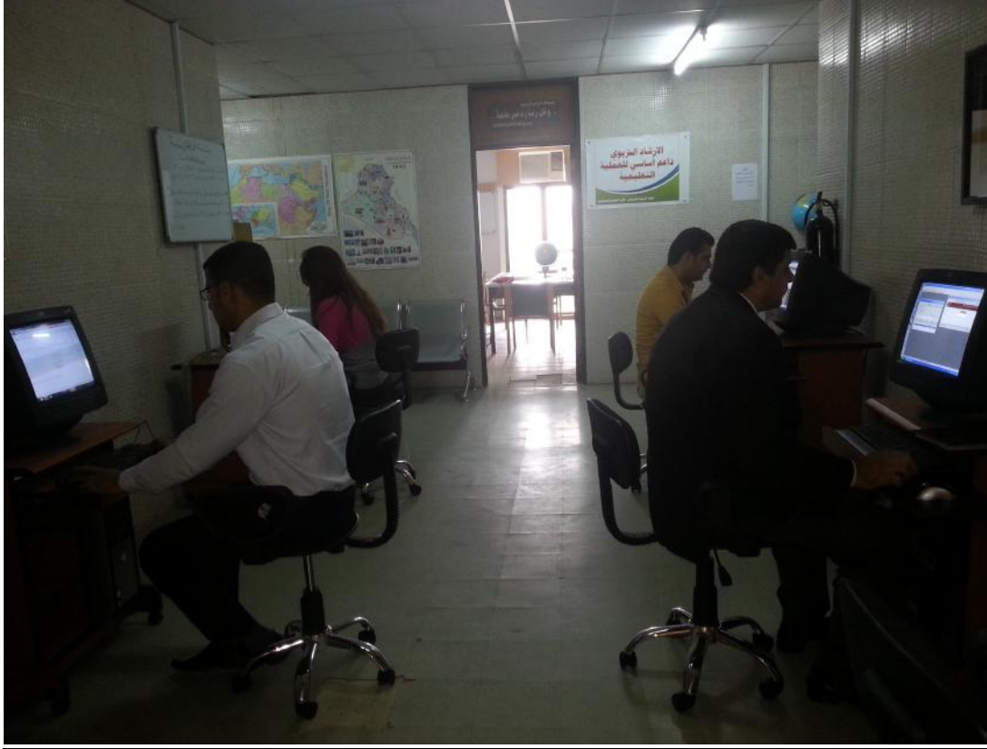
طلبة الدراسات العليا في مكتبة الكلية ٢٠١٣

أصدرت الكلية في أيلول ١٩٩٩ ( دليل اطروحات كلية العلوم السياسية ١٩٧٤-١٩٩٨ ) (الجزء الاول)، تضمن نبذة عن الدراسات العليا في العلوم السياسية في جامعة بغداد، وجداول شاملة بعنوانين الرسائل والاطروحات واسماء كاتبيها والتدريسيين الذين أنجزت تحت إشرافهم مرتبة بحسب سنوات التخرج في مرحلة الماجستير أولاً والدكتوراه ثانياً حتى نهاية العام التقويمي ١٩٩٨. واحتوى الدليل ايضاً على ذكر رسائل الماجستير التي انجزت في مركز الدراسات الدولية ( معهد الدراسات الآسيوية والإفريقية سابقاً) في المدة ( ١٩٨٨-١٩٩٠ ) حينما أرتبط إدارياً وعلمياً بكلية العلوم السياسية منذ عام ١٩٨٧، والذي فك ارتباطه بالكلية عام ١٩٩٥. واصدرت الكلية الجزء الثاني من الدليل الذي غطى المدة من كانون الثاني عام ١٩٩٩ وحتى تموز ٢٠٠١، وقد تم نشر الدليل ضمن العدد الأول من المجلة الدولية للعلوم السياسية الذي صدر في أيلول ٢٠٠١ علماً بأن عدد رسائل الماجستير التي تمت مناقشتها بنجاح ابتداءً من عام ١٩٧٤ وحتى شباط عام ٢٠١٣ قد بلغ (٤٣٧) رسالة، أما أطروحات الدكتوراه التي نوقشت بنجاح منذ عام ١٩٨٧ ولغاية شباط عام ٢٠١٣ فقد بلغت (١٧٦) أطروحة.