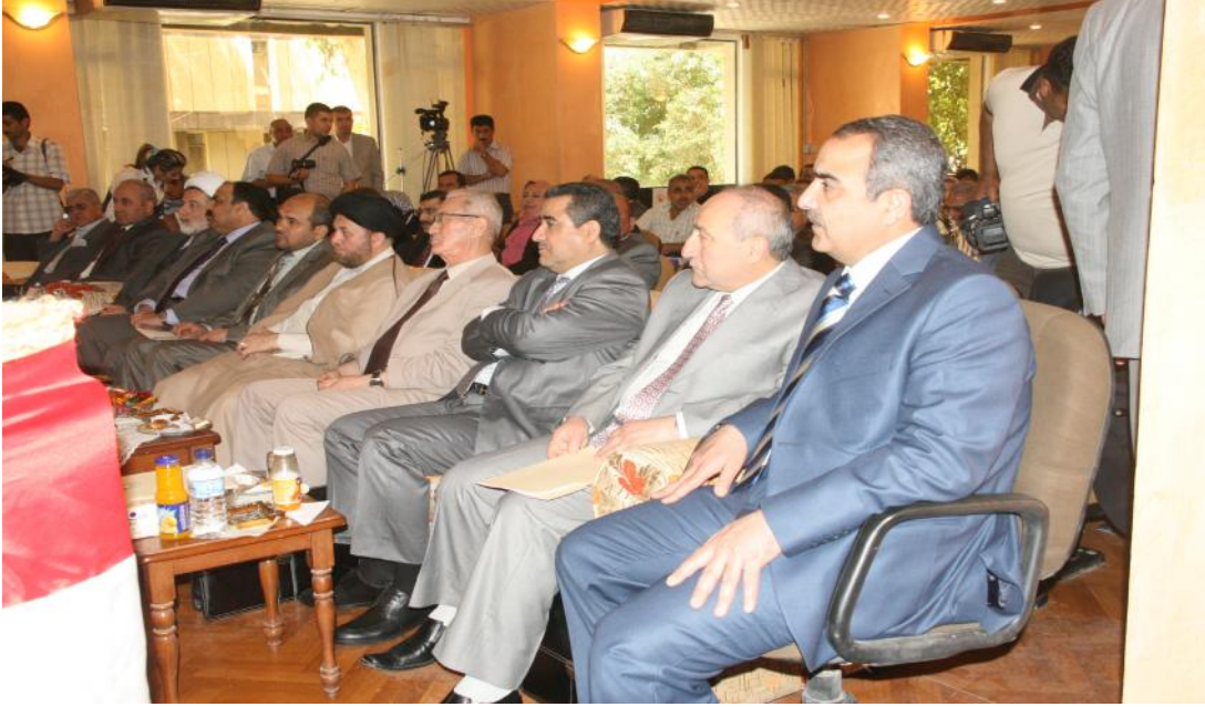
المؤتمر العلمي السنوي للكلية لعام ٢٠١٢-٢٠١٣