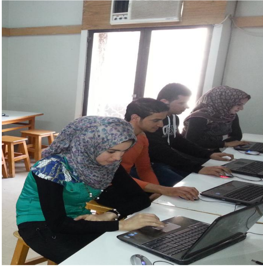
عدد من الطلبة في مختبر الحاسوب