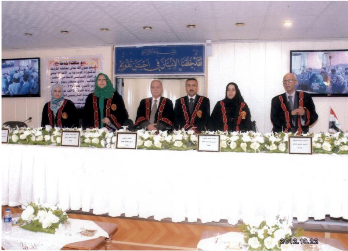
مناقشة احدى اطاريح الدكتوراه في قاعة الحرية/ كلية العلوم السياسية