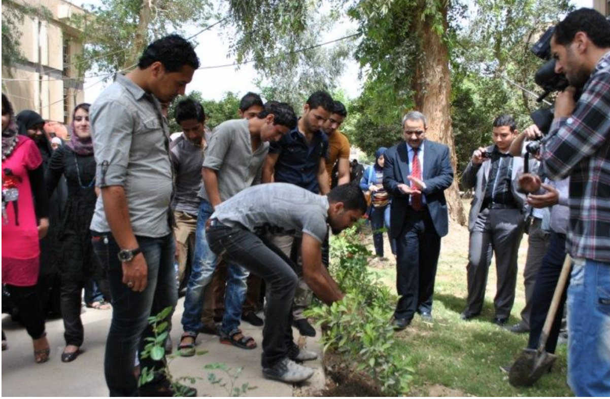
مشاركة عميد الكلية مع خيوة الكلية لزراعة الزهور في حدائق الكلية في العام ٢٠١٢