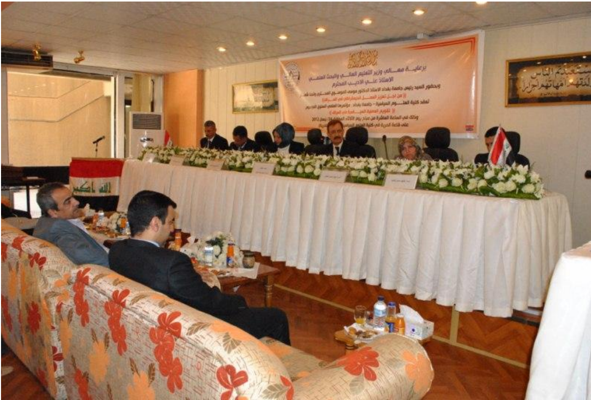
مجموعة من اساتذة الكلية يناقشون بحوث الطلبة في المؤتمر الطلابي السنوي ٢٠١١-٢٠١٢