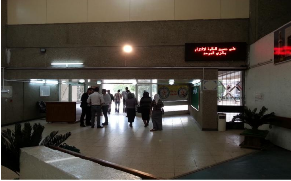
مدخل القاعات الدراسية